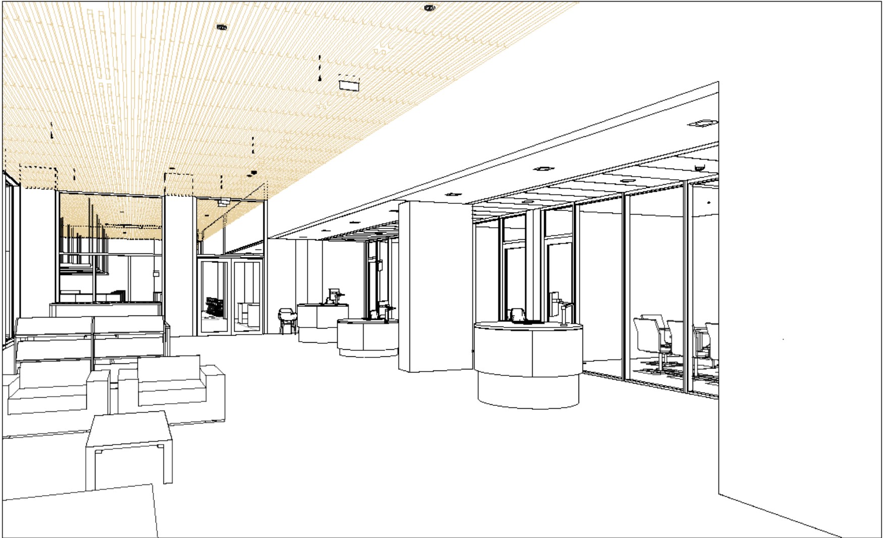
180920 Servicekontor View 1 - from Main Entrance